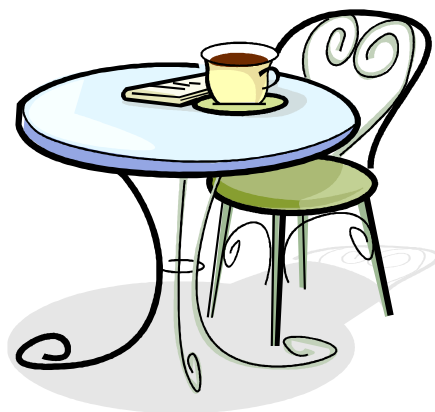
Table d'hôtes le soir

Nous vous souhaitons un agréable séjour dans notre belle région !